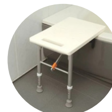
⑤移乗台 (いじょうだい)