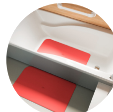
⑥すべり止めマット (一枚)