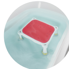
②浴槽台 (よくそうだい)